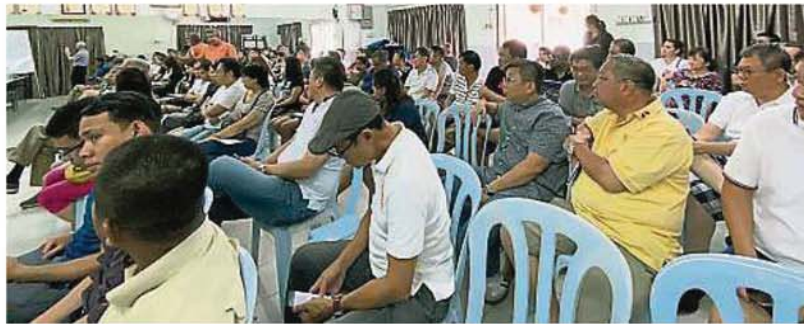
蒲种翠湖苑及阿曼沙里的居民在对话会踊跃发言，向当局作出投诉。

居民声称，更换了智能电表后电费暴涨，让他们成为智能电表下的受害者，并在对话会上提出3大问题，分别是被指篡改电表偷电、电费高涨及被征收巨额款项。