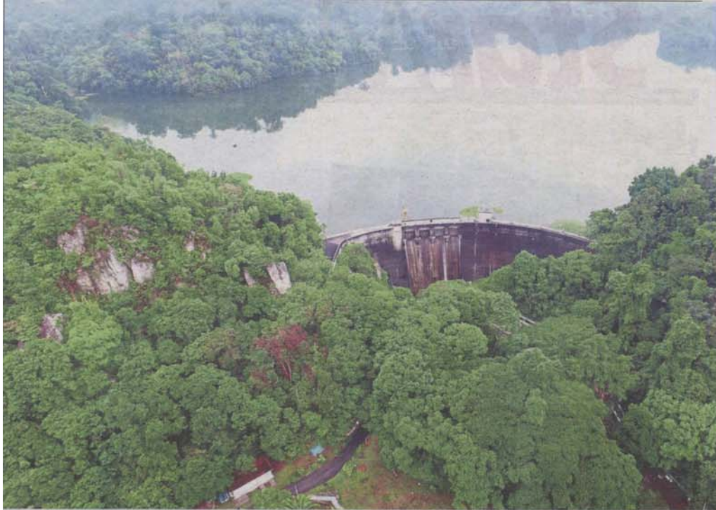
There are concerns that developing the Gombak Selangor Quartz Ridge into a geopark may jeopardise the fragile ecosystem there.