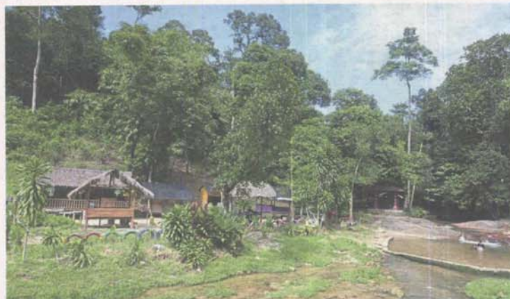
The pristine waters are one of the main attractions of the Bukit Lagong Forest Reserve, one of the areas being considered for development as a geosite.

although the GSQR had data on the history of very important earth formation, admittedly scientific research, publications and reference sources as well as specific information on quartz in the GSQR were still limited.