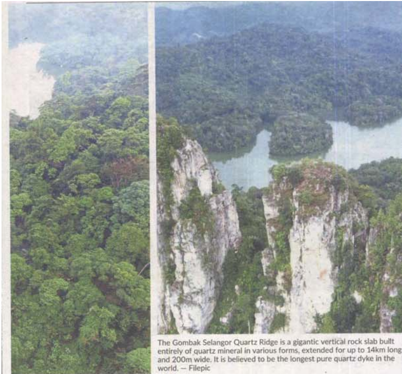
The Gombak Selangor Quartz Ridge is a gigantic vertical rock slab built entirely of quartz mineral in various forms, extended for up to 14km long and 200m wide. It is believed to be the longest pure quartz dyke in the world.