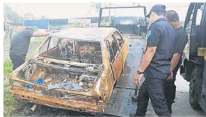
加影市议会把轿车残骸拖走。