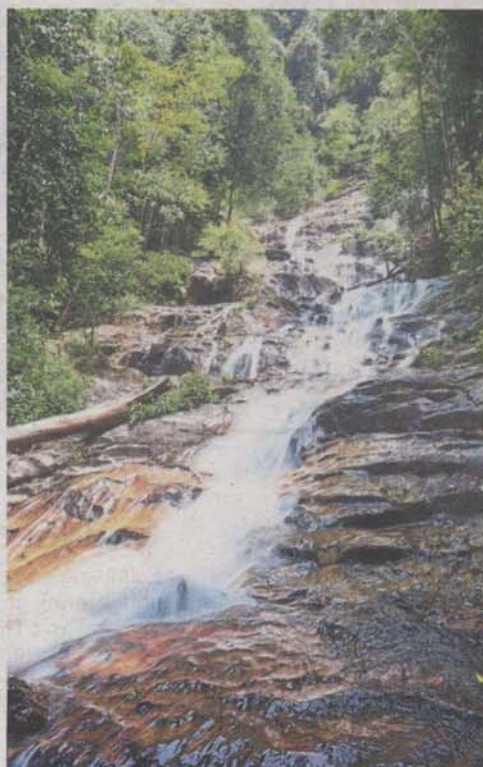
Kanching Eco-Forest Park is one of the suggested sites for the Gombak-Hulu Langat Selangor Geopark.