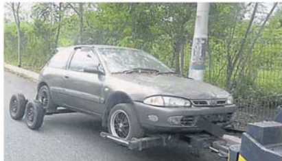
有的车主把轿车停在路旁多时也不处理，过后劳动市议会处理。