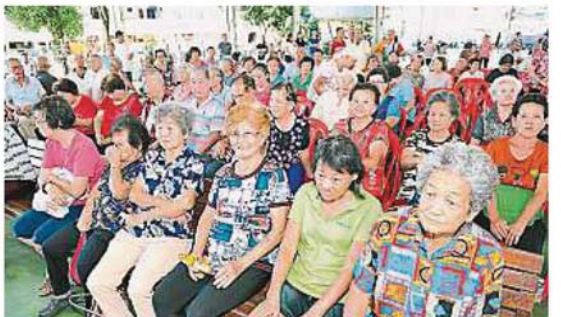
蕉赖11哩新村的200名居民在冬至孝亲敬老活动上受惠。