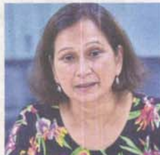
Leela says a more comprehensive management plan and better clarity is needed before the state goes ahead with plans to turn the sites into geoparks.

It is a gigantic vertical rock slab built entirely of quartz mineral in various forms, extended for up to 14km long and 200m wide.