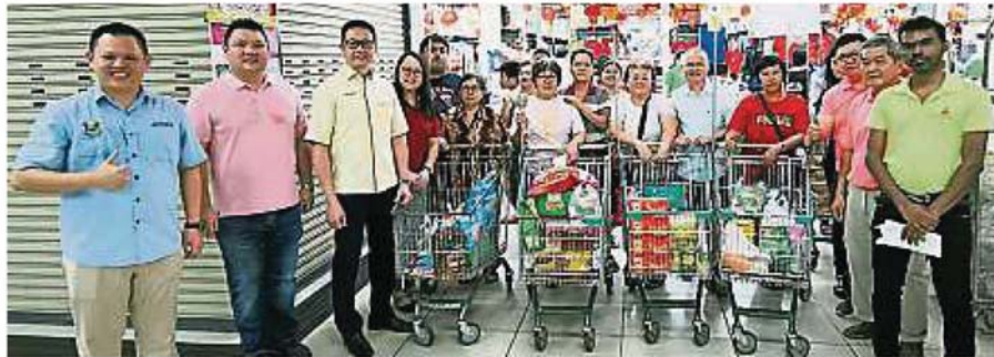
邓章钦（左三）在巴生卫星市宜康省超级市场，陪同民众“走，去购物”，左一起为黄智荣、陈如坚及严玉梅（左四）。

（巴生5日讯）雪州行政议员拿督邓章钦指出，“走，去购物”在农历新年前，派发100令吉现金券给符合资格者，到指定商场购买应节用品，巴生新城区共有950个合格民众参与购物。