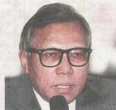
Abdul Rashid says a team of experts opine that the quartz ridge is not ready to be nominated for Unesco certification.

Three combined characteristics make the GSQR a truly unique natural treasure: its size, the fact that it is fully exposed and its pseudo-karst morphology.